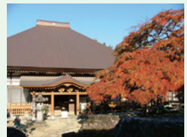
八番 せいまいさん 清泰山西善寺