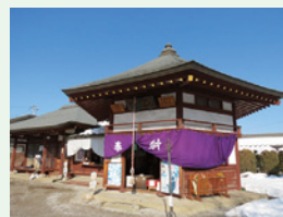
九番 みょうじょうさん 明星山明智寺