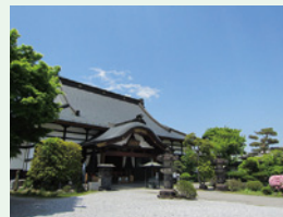
七番 せいまいさん 青苔山法長寺