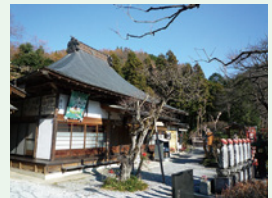
六番 ひょうこさん 向陽山ト雲寺