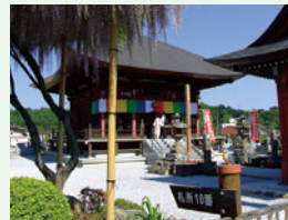
五番 おがわさん 小川山語歌堂

横瀬町には6つの札所があります。札所をつなぐ巡礼道をゆっくり歩いて5時間ほどで巡れます。11月は西善寺のコミネカエデ（埼玉県指定天然記念物、樹齢約600年）の紅葉が見事です。