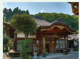
十番 ぼんしょうさん 萬松山大慈寺