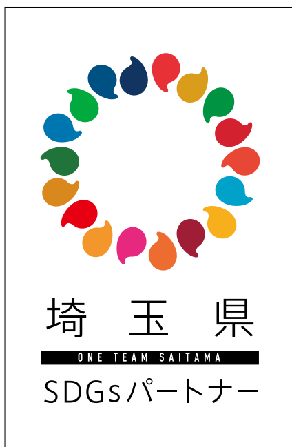
埼玉県 SDGs パートナーロゴマーク

企業・団体の価値向上及び競争力の強化を図り、「埼玉版 SDGs」を共に推進することを目的としており、令和8年2月末現在、登録企業・団体数は2,206となっています。