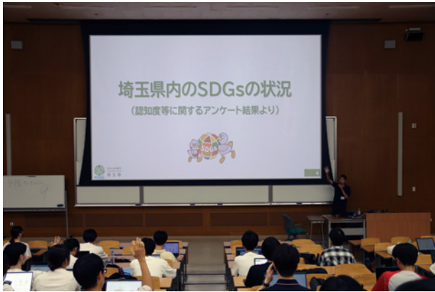
県政出前講座の様子

を令和3年11月にリリースし、令和8年2月末現在、33,154件の登録をいただいています。一方、令和7年9月時点で、SDGsという言葉を知っている県民の割合は、ほぼ100%に達しており、アプリ運用開始時の目的の一つであったSDGsの普及については一定の成果が得られたことから、『S 3 (エスキューブ)』については10月末で終了する予定です。