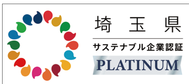
埼玉県サステナブル企業認証制度プラチナ認証ロゴマーク

注：SDGs の認知度……「内容を人に説明できる」「内容がある程度知っている」と回答した人の割合 SDGs の取組状況……「既に取り組んでる」と回答した人の割合