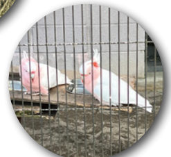
クルマサカオウム