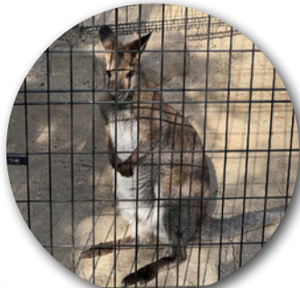
ベネットアカクビワラビー