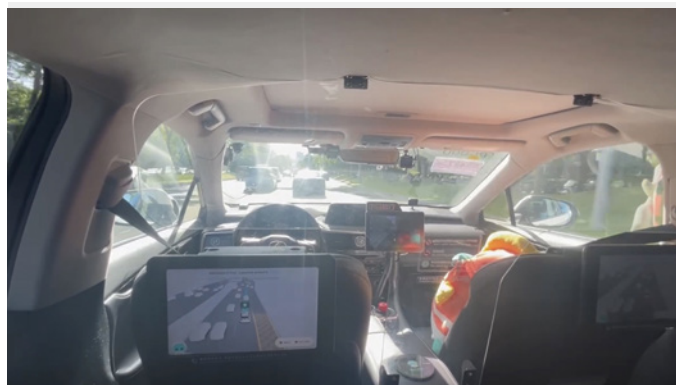
自動運転タクシーとその社内の様子