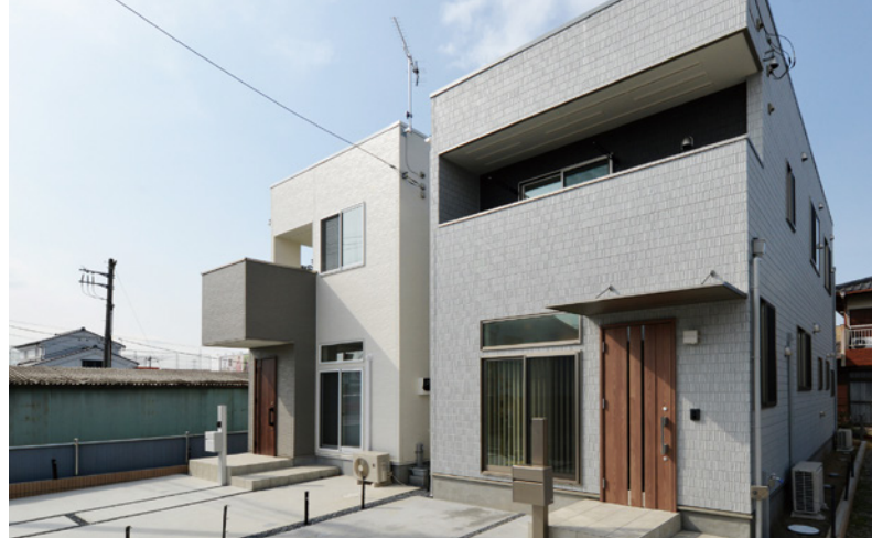
ハッピー住宅外観

「新婚さんにもマイホームを持ってほしい！」——この思いからローコスト住宅ブランドが始まった。創業114年の技術力を生かした効率的な施工により工期を短縮する。必要十分な標準仕様で設備を規格化する。住宅展示場には出展せずにモデルハウスを建てて一定期間で売却する。WEB広告に絞ることで広告費を削減する。様々な取り組みから生まれたお値打ちものだ。