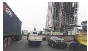
写真上：高速道路の高架化が進むチカンパック高速