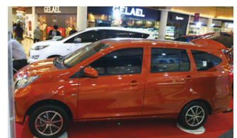
写真下：2013年導入されたローコスト・アンド・グリーンカー (LCGC) の生産にあたって、日系自動車部品メーカーの進出が相次いだ。