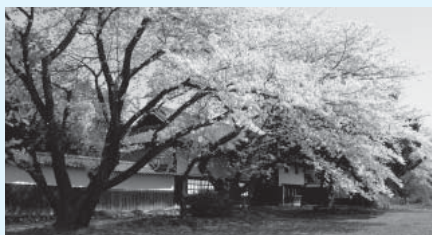
豪農であった根岸家の面影を残す「根岸家長屋門」

● 根岸家長屋門 …豪農であった根岸家の面影を残す長屋門。正面左側は振武場、右側は当時の番頭たちの帳場。庭には私塾の三余堂が建てられていたことが、屋敷の見取り図から読み取れる。