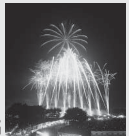
毎年真夏の夜に盛り上がる「熊谷花火大会」