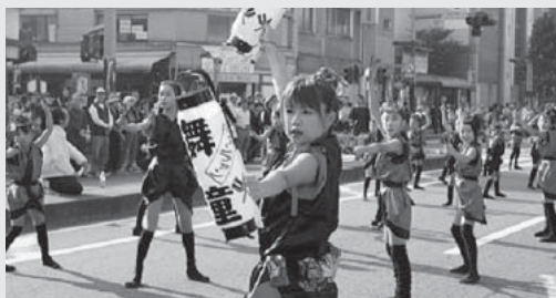
11月の「えびす大商業祭」で繰り広げられる「オ・ドーレなおざね」