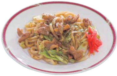
熊谷B級グルメ選手権で グランプリを獲得した 焼きうどんの「熊谷ホルどん」