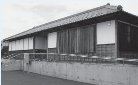
日本最初の公認女医となった「荻野吟子記念館」