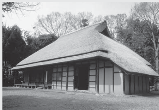
国の重要文化財に指定されている「平山家住宅」