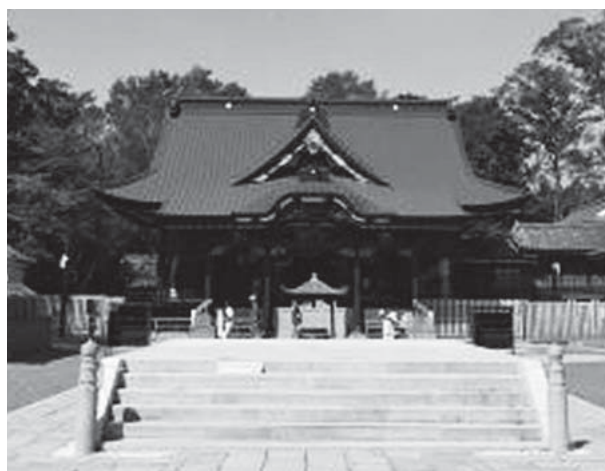
妻沼聖天山本殿の「聖天堂」

ことから、“装飾建築の到達点”とも評され、“江戸時代建築の分水嶺”だとの評価が高く、日光東照宮を彷彿させる本格的装飾建築。その精巧さから“埼玉日光”とも称されているが、再建後250年という歳月から建物の傷みが激しくなったため、2003年（平成15年）10月から“平成の大修復”が行われていた。約7年の歳月を掛けて、建物の傷みや剥落した