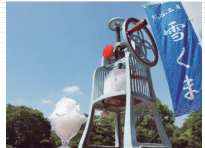
熊谷ならではのかき氷ブランド “雪くま”

同市では、来訪者が食べ歩きながら観光することで、少しでも長く市内に滞在し、地域経済に貢献してもらおうと、特にPRには力を入れている。観光マップに食べ物を紹介するだけでなく、市内の飲食店や食品製造企業には、常に新しい商品開発を促しているが、その一環から、今年10月に初めてB級グルメ大会を開催した。前年の「熊谷B級グルメ選手権」を発展させた大会で、この年には「熊谷ホルどん」というメニューがグランプリを獲得。現在、新たなB級グルメのメニューとして、全国にPR中だが、今年の大でも人気を博している。