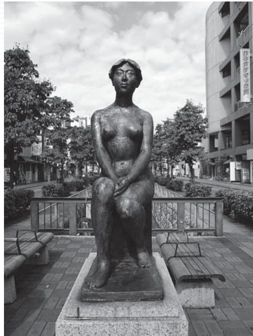
星川通線シンボルロードのブロンズ像

もう一つの旧大里町と旧江南町を訪ねるコース内には、「根岸家長屋門」や「文殊寺」などの史跡のほか大里、江南の二つの農産物直売所がある。“よくばり”と言うほど見所が多く、走行距離も約25キロに及び、ゆっくり走れば一日の観光コースとなる。これら観