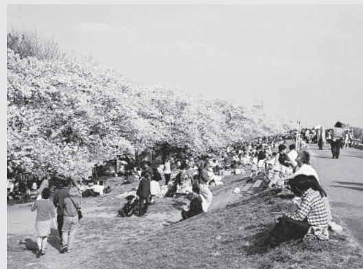
春の行楽客で賑わう「熊谷堤」の桜