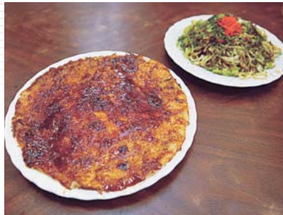
熊谷B級グルメ大会で人気の “フライ”