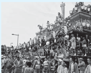
「熊谷うちわ祭」の山車と屋台