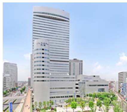
<第7回セミナー会場>

埼玉県さいたま市大宮区桜木町 1-7-5 ソニックシティビル5階501会議室 JR 大宮駅西口より徒歩3分