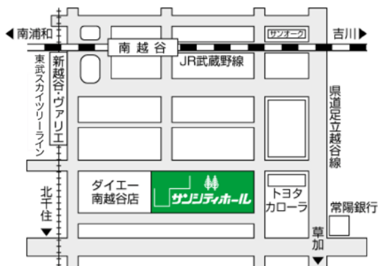
<第6回セミナー会場>

埼玉県越谷市南越谷 1-2876-1 越谷サンシティホール第一会議室 JR 武蔵野線南越谷駅、東武スカイツリーライン新越谷駅より徒歩3分