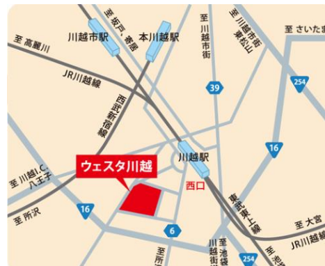
＜第2回セミナー会場＞

埼玉県川越市新宿町1丁目17番地17 JR川越線、東武東上線「川越駅」西口より徒歩約5分 西武新宿線「本川越駅」より徒歩約15分